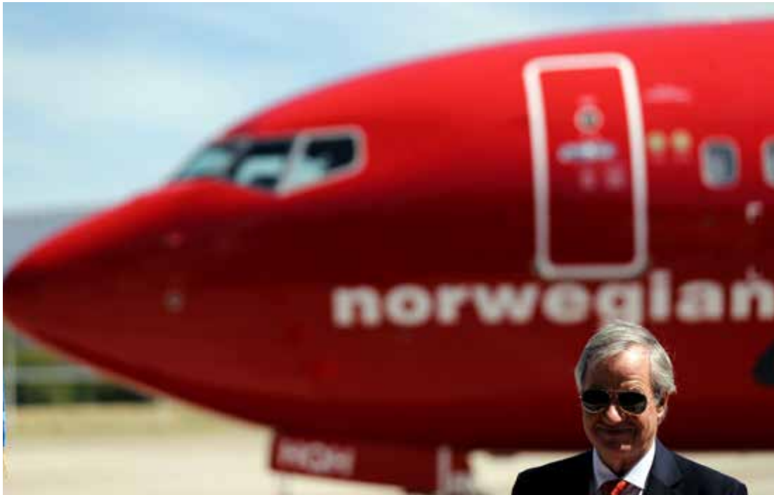
Bjørn Kjos' Norwegian leverer gode septembertall.