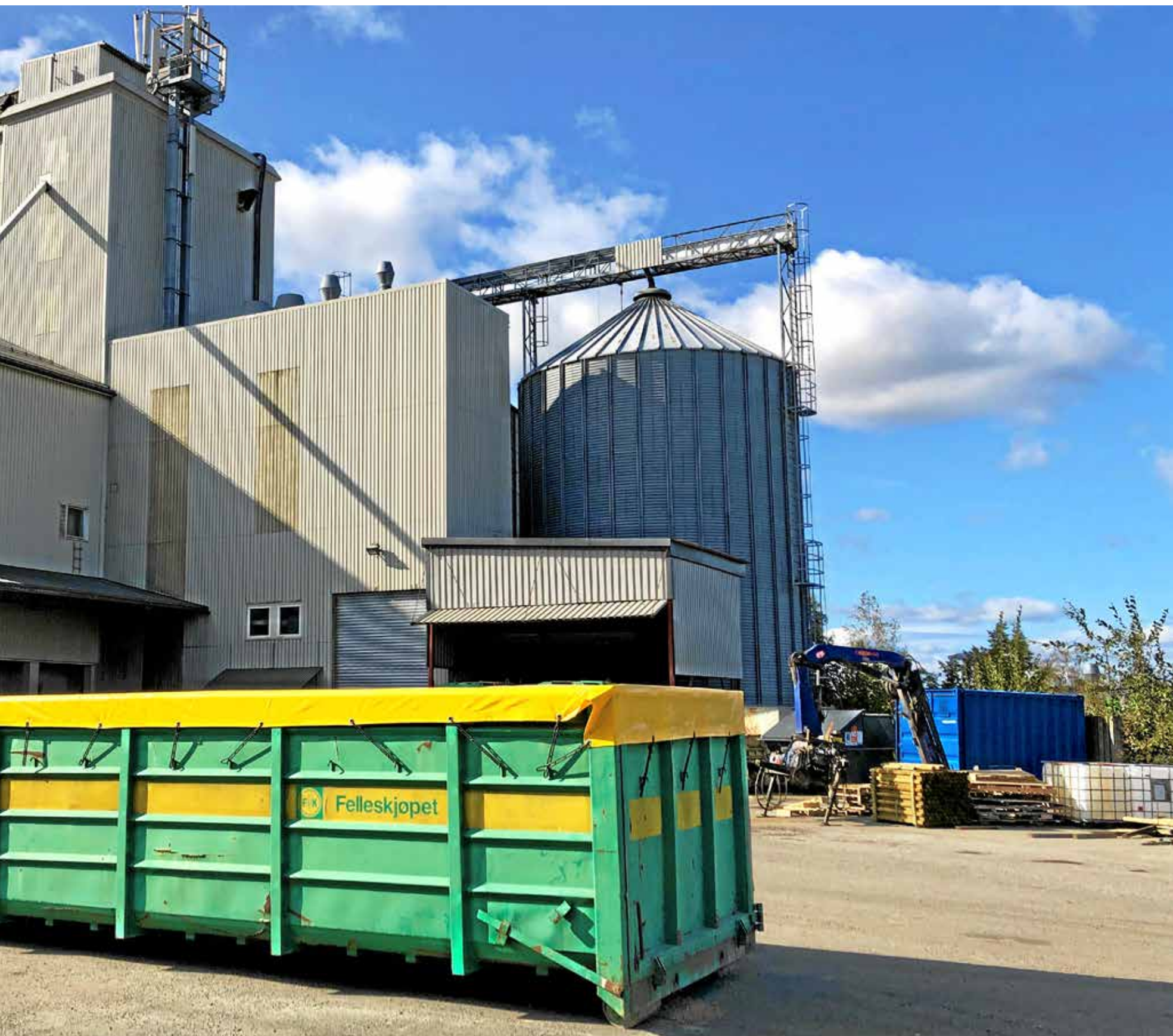
Det på kraftfôrfabrikken på Kambo fra mandag vil mangle rundt 500 tonn kraftfôr til kylling og gris hver dag.